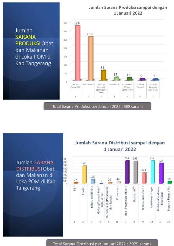
Gambar 4. Jumlah sarana produksi dan sarana distribusi

1.5.2.1 Jumlah Sarana Produksi dan Distribusi Obat dan Makanan Loka POM di Kabupaten Tangerang memiliki total sarana produksi obat dan makanan sebanyak 688 sarana dan 3929 sarana distribusi obat dan makanan yang menjadi sasaran pengawasan dengan rincian sebagai berikut: